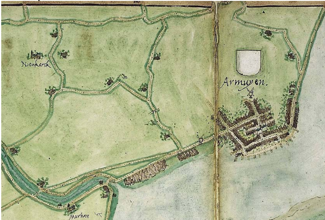
Oudst bekende kaart van Arnemuiden, met zowel Brakenburg als Waayenburg ten noordoosten van Armuyen afgebeeld, door Jacob van Deventer.

Rond 1555 kreeg kaartenmaker Van Deventer van de Spaanse koning Philips II de opdracht om stadsplattegronden van plaatsen in de Nederlanden te maken. De Lage Landen lagen binnen Philips invloedssfeer. Een paar atlanten - de Planos de ciudades de los Países Bajos - was Van Deventers uiteindelijke resultaat. Op de vierde pagina van de derde atlas vinden we het plan van 'Armuyen'.