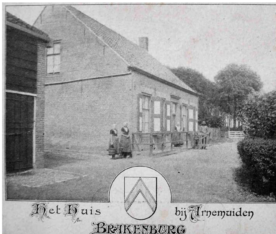
Het woonhuis Brakenburg in het begin van de twintigste eeuw