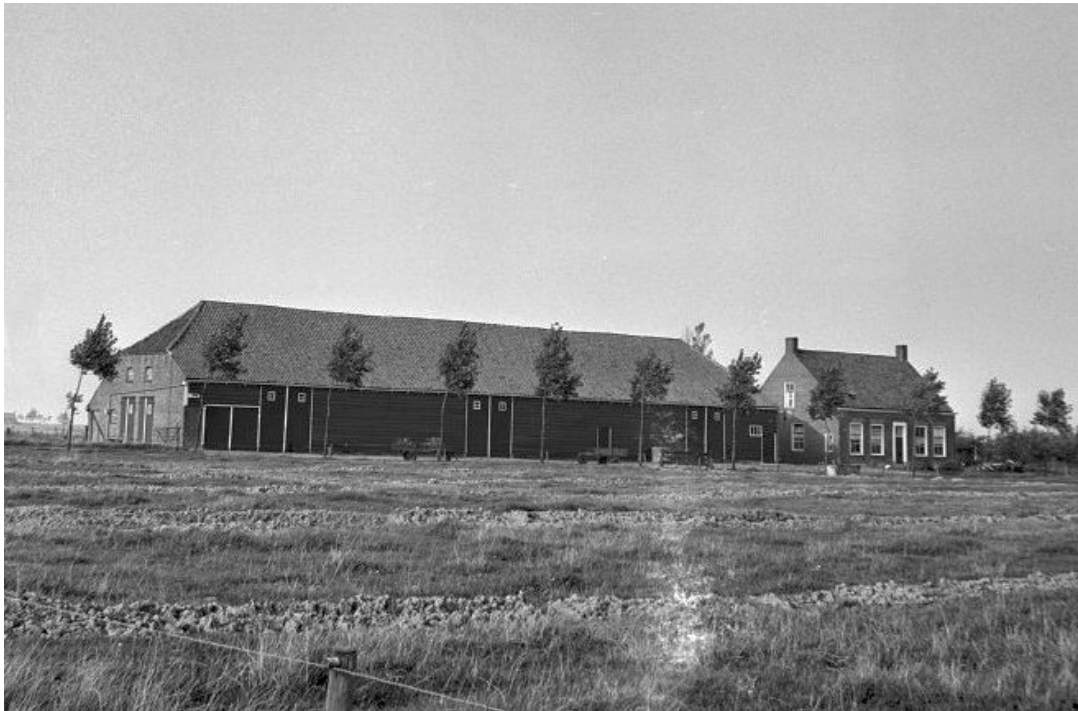
De boerderij Brakenburg ca. 1963

Rond 1970 kwamen de plannen van het Arnhemse gemeentebestuur op tafel voor de bouw van een nieuwe wijk, even buiten de kern van het plaatsje. De boerderij werd al in december 1973 door de gemeente Arnhem van Van Huffel gekocht.