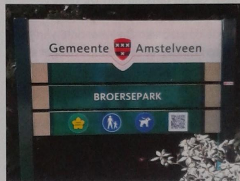
Broersepark, Amstelveen, 2017.