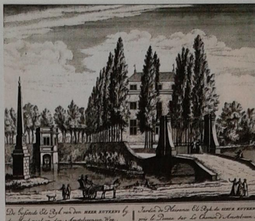
Buitenplaats Elsrijk, 18de-eeuwse gravure.

Interessant is vooral het feit dat er voor 1961 een weg was die aansloot op de westzijde van de Machineweg, met de naam Wolfert van Borseleweg. Een bescheiden deel daarvan werd in 1961 aan de Laan Walcheren toegevoegd waardoor er, al dan niet bewust, een link ontstond tussen de Laan Walcheren en de laatmiddeleeuwse Walchenaar Wolfert VI van Borsele. Wolfert was in de vijftiende eeuw stadhouder en admiraal en eigenaar van het stamslot Zandenburg nabij Veere. Dat Wolfert zich heer van Veere mocht noemen is wel bekend. Hij was echter ook ambachtsheer van Amstelveen en Nieuwer-Amstel en dat verklaart het feit dat er in deze contreien een straat naar hem werd genoemd.