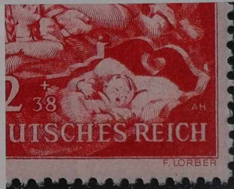
Detail postzegel Deutsches Reich.