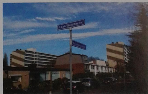
Laan Walcheren, Amstelveen, 2017.

De bijna een kilometer lange Laan Walcheren ligt even ten noorden van het winkelcentrum Stadshart op de grens tussen Elsrijk en Randwijck. Net als op Walcheren dragen ook hier diverse wijken namen van buitenplaatsen en boerderijen. Naast de Laan Walcheren loopt een water dat is omzoomd door bomen, struiken en ander groen. In het westelijke deel is nog altijd een restant van de oude polderdijk te herkennen.