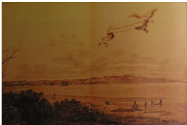
Panorama van Cabo de Santo Agostinho, ca. 1640. (Caspar Barlaeus, bew. door S.P. l'Honoré Naber, 'Nederlandsch Brazilië onder het bevel van Johan Maurits Graev van Nassau, 1637-1644', 's-Gravenhage 1923)