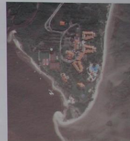
Hierboven: van fort Van der Dussen (lokatie onderste punt afgebeelde luchtfoto) noch van fort Ghyselin is tegenwoordig nog iets te zien.

Hieronder: kaart van Cabo de Santo Agostinho en de baai voor fort Van der Dussen (links onder het eiland Walcheren). Het karaalrif voor de kust is duidelijk zichtbaar, ca. 1640. (Caspar Barlaeus, bew. door S.P. l'Honoré Naber, 'Nederlandsch Brazilië onder het bevel van Johan Maurits Graev van Nassau, 1637-1644', 's-Gravenhage 1923)