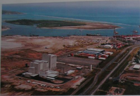
Luchtfoto van het eiland Ilha da Cocalia (boven), voorheen Walcheren. De zandsuppletie aan de zuidzijde is duidelijk zichtbaar.

nog niet gelicht in Brazilië of het verdedigingswerk werd al verlaten. Er is tegenwoordig niets meer terug te vinden van het fort. Ruud Paesie ging er ter plekke zoeken en vermoedt dat eventuele resten bedolven zijn onder een dikke laag zand. Het eilandje Walcheren bestaat nog steeds en heet nu Ilha da Cocalia, dat kokospalmeneiland betekent. Cocalia is door de eigenaar, een lokaal havenbedrijf, door middel van zandsuppletie tot één eiland gebouwd. Het voormalige Braziliaanse Walcheren is omgeven door een haven- en