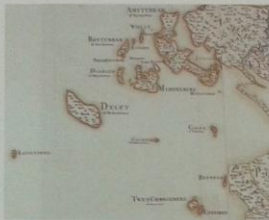
Middelburg-eiland, fragment uit de 'Kaart van het eyland Ceylon', Duperron, 1789. (Zeeuwsche Bibliotheek, Grote atlas van de VOC, deel IV, Ceylon, 2008)