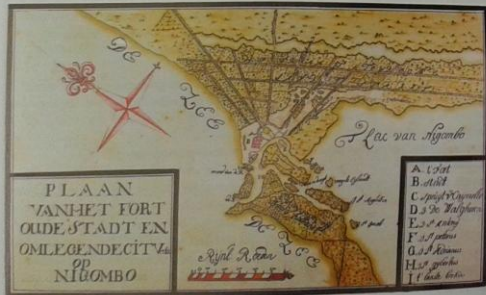
'Plaan van het fort, oude staet en omlegende situatie op Negombo', Anoniem, 1721. Negombo wordt aangegeven met de letter B en het eiland Walcheren met D.

burg. Het laatstgenoemde eiland heette in de lokale taal Poengertivo of Punkudutivo. Tegenwoordig hebben bijna alle eilanden inheemse namen. Alleen Delft staat nog in de Nederlandse taal op de kaart.