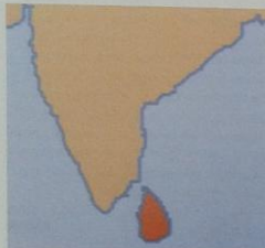
Locatie van Sri Lanka, gelegen ten zuiden van India.

gezien als een van de voorlopers van de Verenigde Oost-Indische Compagnie (VOC). De belangrijkste man die Van Spilbergen