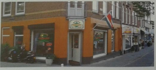
Aan de Beukenweg in Amsterdam is een Surinaams-Javaans eethuis naar het dorp genoemd: Warung Domburg.