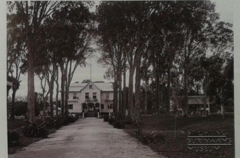
Het oude heren- of plantagehuis van Domburg.

rug in Nederland, permittieren om een huis aan het chique Lange Voorhout in Den Haag en twee buitenplaatsen in Wassenaar te kopen. Hij werd zelfs de koning van Suriname genoemd. Elias Bouvet werd dus de eigenaar van de westelijke helft, inclusief 'het woonhuis' ofwel het voornaam heren- of plantagehuis. Het ligt voor de hand dat Bouvet de naamgever was van zijn zelfstandige plantage, maar waarom koos hij voor Domburg? Hadden de Bouvets of de Houtkoopers, de familie van zijn echtgenote, iets met de Walcherse smalstad? Dat weten we helaas niet. De naam Domburg verscheen voor het eerst in 1719 op een kaart van Jacob Hengevelt. Elias Bouvet werd geboren in het Franse Alençon, vertrok naar Suriname en trouwde er in 1716 met Jeanne Houtkoopers, dochter van Nicolaas Houtkoopers en Philippa Bachman. Jeanne kwam ter wereld op het Nederlands-Caribische eiland Sint Eustatius, waar haar vader commandeur was. In Suriname werd Nicolaas 'capitein van de burgeren' genoemd. Na ongeveer vier jaar huwelijk overleed Elias. Jeanne bleef kinderloos achter en hertrouwde in 1723 met Pierre Thouron,