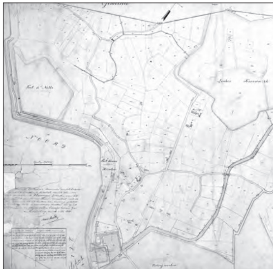
Het inmiddels verdwenen hof Grooten Boomgaard (noordelijk van hof Bonnedijke), ca. 1835.