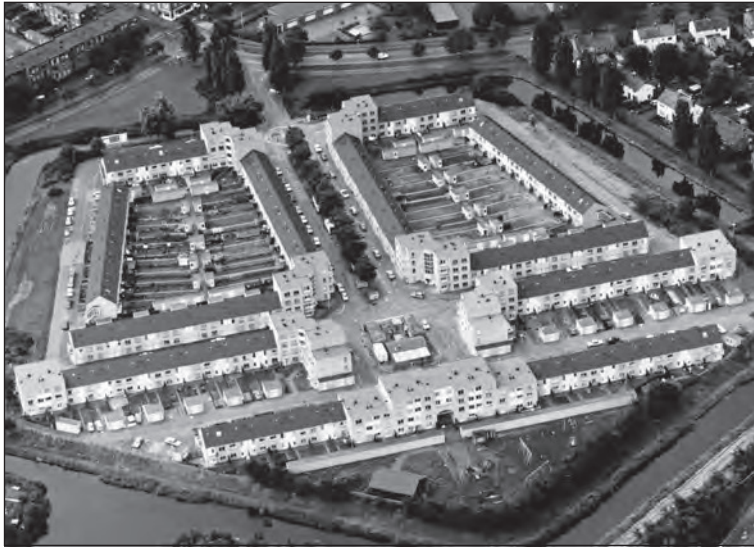
Woonwijk Het Fort van bovenaf gezien, 1987.

finitief opgeruimd. In de twintigste eeuw, om precies te zijn in 1971, werden bij het bouwrijp maken van woonwijk Westerzicht de funderingen van het eens zo machtige Aldegonde blootgelegd en in kaart gebracht. Jammer dat de wijk er op werd gebouwd. Een kleine herinnering aan het kasteel zou wel op zijn plaats zijn geweest. Gelukkig raakte de familie Steengracht niet in de vergetelheid in West-Souburg. Zij wordt geëerd met een straatnaam.