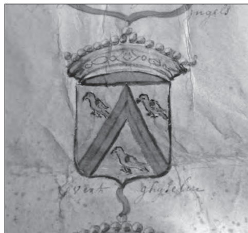
Familiewapen van de Ghyselin's, met de drie papegaaien.

Waarom Evert de naam 'Papegaayenburg' in het leven riep, is duidelijk. Het familiewapen van de Ghyselins bevatte een drietal papegaaien.