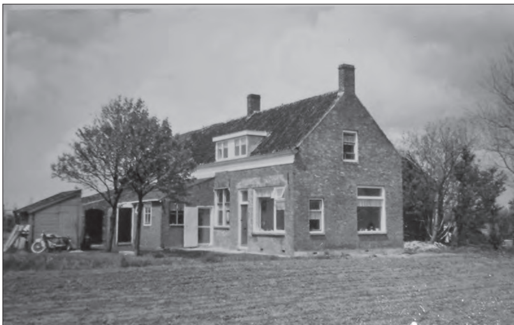
Papegaaienburg vlak voor de afbraak in 1979