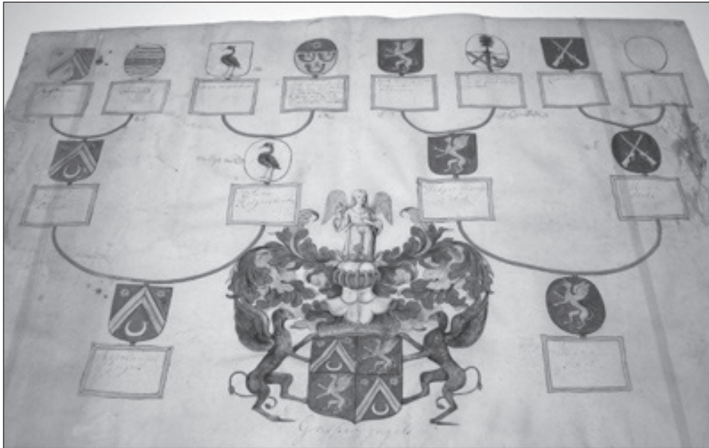
De familiewapens van Ingels (links) en Schot (rechts).