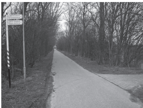
Een deel van de huidige Zuidbeekseweg – tussen de bocht bij het woonwagenkamp en de Jacoba van Beierenweg – was de toegangslaan ofwel de dreef van Hof Noordbeek.