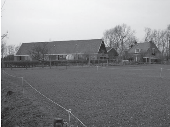
De huidige boerderij Noordbeek aan de Jacoba van Beierenweg