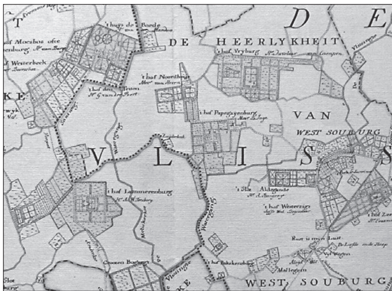
Kaart van Walcheren, gebroeders Hattinga, ca. 1750

stempeld. Die status krijgt het, zoals eerder beschreven, pas later.