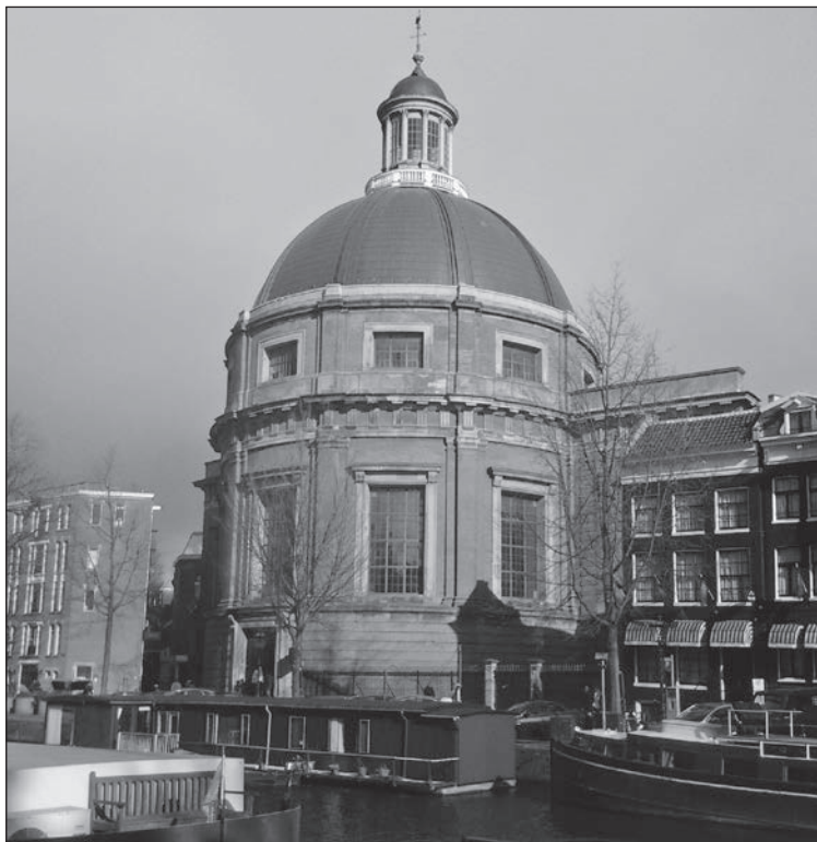
Dortsman kreeg de opdracht om een nieuwe kerk te ontwerpen, dat werd de Ronde Lutherse Kerk.