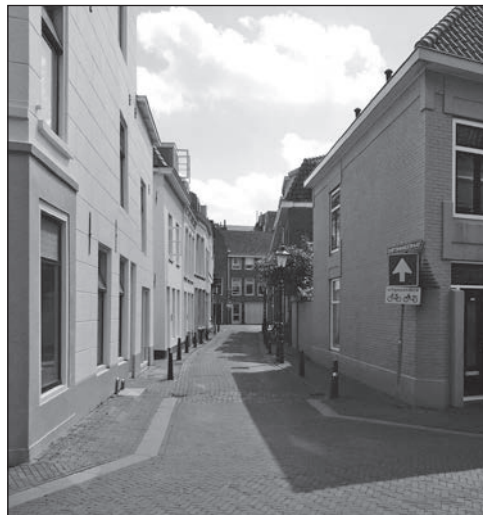
De Dortsmansstraat in Vlissingen.

Op de oosthoek van het slop en het Lange Groenewoud bevond zich het ouderlijk huis van Maria Schot, de weduwe van Apollonius Ingels, grondlegger van de bekende buitenplaats Swanenburg. Maria