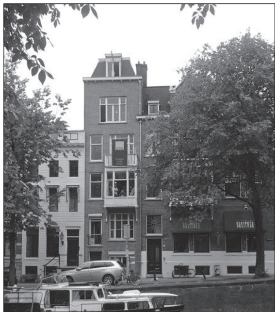
In Amsterdam woonde Dortsman aan de Herengracht 625, rechts naast het witte pand. Het huis bestaat niet meer; er is hier een ander en wat smaller huis gebouwd.

Het huis kreeg in zijn tijd een lugubere naam aangemeten door de tekeningetjes, letters en tekens die er, volgens de overlevering althans, met het eigen bloed van de krankzinnig geworden Van Beuningen op waren getekend. Het is tot op heden niet gelukt deze 'bloedvlekken' te verwijderen. Belangrijk is ook het zogeheten Sixhuis aan de Herengracht 619, één van Dortsmans eerste ontwerpen en gebouwd voor Jan Six. Deze invloedrijke en kunstminnende bestuurder onderhield nauwe contacten met Rembrandt. Hij was getrouwd met een dochter van de machtige magistraat Nicolaes Tulp. De voorgevel van het Sixhuis is zo sterk gewijzigd dat het pand nog nauwelijks herkenbaar is als 'een Dortsman'. Naast het Sixhuis ontstond bovendien een groot Dortsmanproject van een achttal aan elkaar grenzende panden op de hoek van de Herengracht en de Amstel. Op Herengracht 625 ging Dortsman zelf wonen. Zijn huis bevatte een bijzonder balkon met het beeldhouwde monogram ADV (Adriaen Dortsman Vlissingen) en de