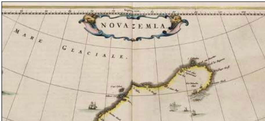
Het Vlissinger Hooft op Nova Zembla, uit: Atlas van Loon, 1664.

Rusland om een noordelijke vaarroute naar China te zoeken. Twee eerdere en tegelijk mislukte pogingen stonden onder bevel van stuurman Willem Barentsz. Deze derde expeditie stond wederom onder leiding van Barentsz, nu aangevuld met Jacob van Heemskerck. Bij het eiland Nova Zembla liep het schip van de beroemd geworden ontdekkingsreizigers vast in het poolijs. De bemanning moest negen barre maanden overwinteren in een zelfgebouwd huis, dat we kennen als Het Behouden Huys. Het onderkomen beschermde hen tegen de extreme kou en ijsberen. Na de winter bereikten twaalf overlevenden in open sloepen de bewoonde wereld. De overblijfselen van de overwintering, zoals huisraad, wapens en gereedschap, werden pas in de negentiende eeuw gevonden. Een deel ervan is te zien in het Rijksmuseum in Amsterdam. Op Nova Zembla werden vele Nederlandse namen in het leven geroepen en op de kaart gezet. Zo ligt Vlissinger Hooft of Kaap Flossingsky aan de noordoost kust van het deeleiland Severny, op ongeveer vijftig kilometer van de plek waar Het Behouden Huys werd opgezet.