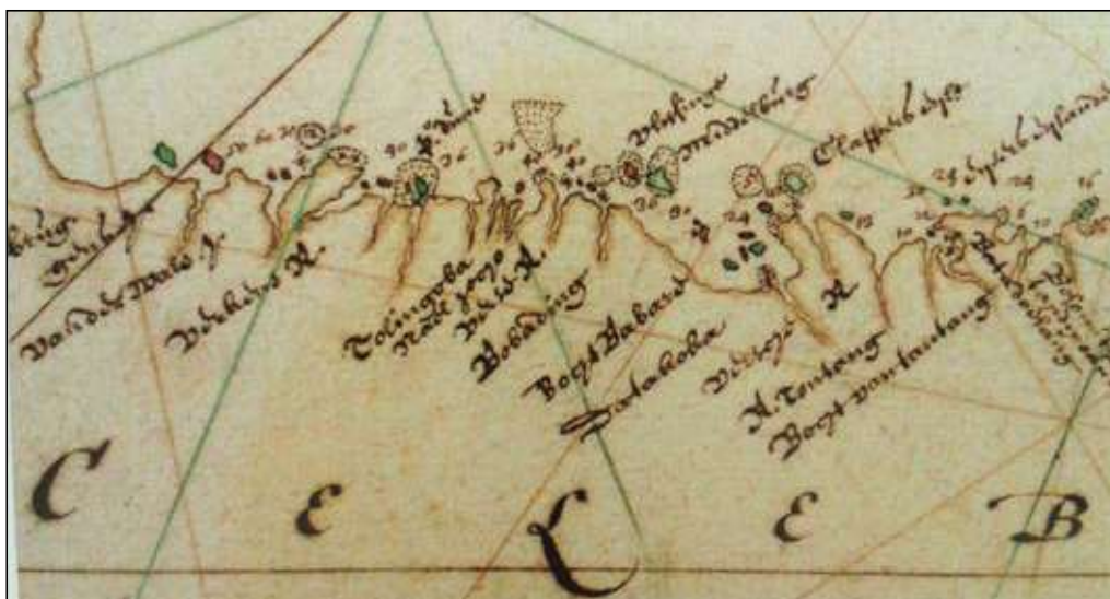
Het eiland Vlissinge aan de noordkust van Celebes, uit: Grote Atlas van de VOC, deel 1.

In 1604 arriveerden Wijbrand van Warwijck en zijn mannen op het hoofdeiland, dat eveneens Penghu heette. Het was de bedoeling dat de VOC, de toen nog jonge handelsmaatschappij, vanaf de strategisch gelegen Pescadores contacten zou gaan opbouwen met het tot de verbeelding sprekende China, maar dat plan liep op niets uit. China toonde geen interesse. In de