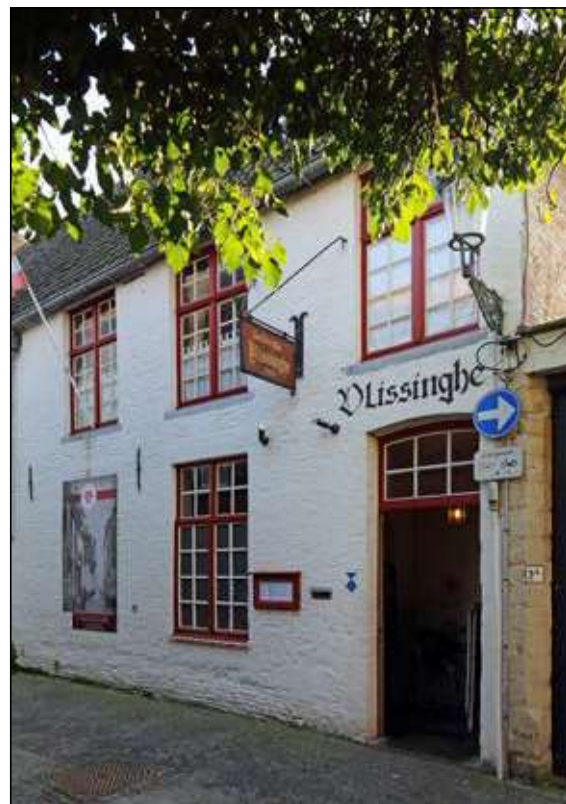
Café Vlissinghe te Brugge.

Straten die zijn genoemd naar Vlissingen treffen we vanzelfsprekend aan op diverse plaatsen in Nederland. Maar ook in het buitenland ontbreekt de Walcherse stad niet. Zowel ver weg, in het Zuid Amerikaanse land Guyana, als dichterbij huis, in Allen-