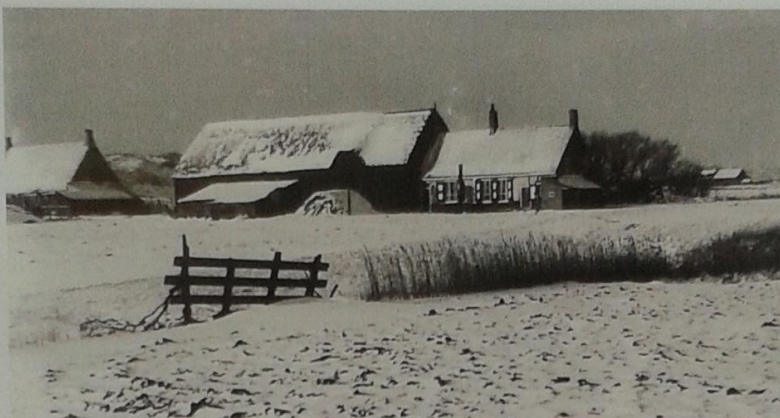
Boerderij Swanenburg in een winters landschap, circa 1925.