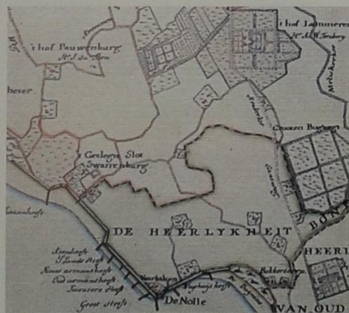
Detail uit de Kaart van Walcheren van de gebroeders Hattinga (ca. 1750) met de vermelding 't geslegte Slot Swanenburg.