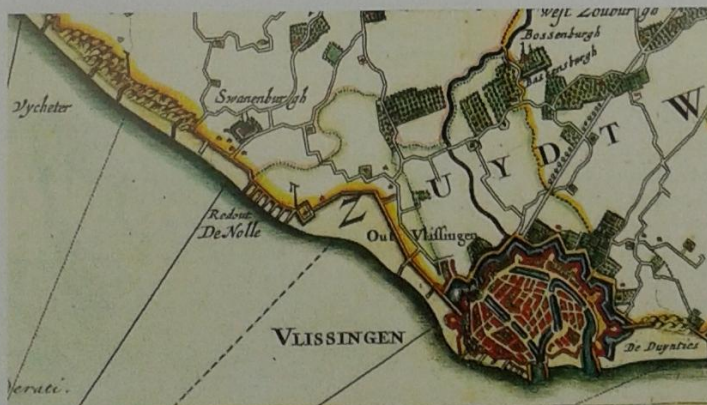
Detail uit de Kaart van Walcheren van N. Visscher/Z. Roman (ca. 1655)

Zoals gezegd, kreeg het belangrijkste bouwwerk, het herenhuis, geen gangbaar ontwerp. Meestal had zo'n huis wel iets weg van een stadspand. Ingels liet echter een gebouw van kasteelachtige allure verrijzen, want het van torentjes voorziene huis werd immers omringd door zowel een gracht als muur. Van een kasteel in de klassieke zin van de betekenis was geen sprake omdat verdedigbaarheid, een van de kenmerken van een kasteel, in die tijd niet meer van toepassing was. Swanenburg werd 'slot' genoemd. De term kasteel werd in Ingels' tijd nog niet gebezigd. Die benaming kwam pas in de negentiende eeuw in zwang. Het slot werd vooral in de lente- en zomermaanden en bij feestelijke gelegenheden bewoond. Een buitenplaats was niet alleen een ideaal toevluchtsoord om op gezette tijden de stank en de hitte van de stad te ontvluchten, maar diende tegelijk als pronkstuk. Indruk maken was in die tijd bijna van levensbelang. Een buiten moest echter ook