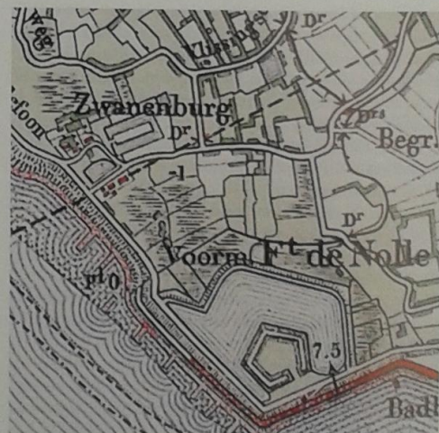
Detail uit de Chromo-topografische kaart van Walcheren (ca. 1910)

vinden we in de vorm van een bij de boerderij horende waterpartij in het Vlissingse Nollebos, direct achter het clubhuis van tennisvereniging DOS, en in de vorm van het eerder genoemde eiland waarop het slot tot circa 1730 stond. Deze restanten zijn nog altijd goed zichtbaar. Het is een kwestie van toeval dat het eiland, nu schiereiland, behouden is gebleven. Tijdens de inundatie werd het eiland weliswaar aangetast, maar bleef het behouden. Vervolgens heeft men op het eiland en in de verdere omgeving, het zogeheten Westduingebied, bomen geplant. Dit stukje kustgebied vormde op die manier een soort verlengstuk van het eerder aangelegde Nollebos. Het eiland lag weliswaar binnen de bestemmingsplannen uit de jaren zeventig en tachtig, maar de bosstrook werd bestempeld als "te handhaven bosgebied". De strook lag tussen de duinen in het westen en een watergang in het oosten. Bij de voltooiing van het Westduinpark in 1982 heeft men het eiland dus ongemoeid gelaten. Hoogstwaarschijnlijk hebben de planmakers in het verleden niet beseft dat hierbinnen het eiland lag waarop Slot Swanenburg van Apollonius Ingels ooit stond te pronken. 40