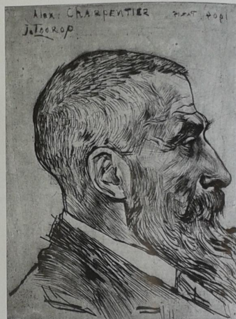
Portret van Alexandre Charpentier door Jan Toorop, tekening uit 1904

De kunstenaar koos in zijn scheppingen vooral kinderen en moeders met kinderen als thema. Zij verschijnen veelvuldig op medailles, plaquettes en in de vorm van beelden. Zo was Jeune mère allaitant son enfant , ook wel Maternity genoemd, uit circa 1882 één van zijn vroegste creaties. Het zou zelfs het bekendste werk uit Charpentiers oeuvre worden.