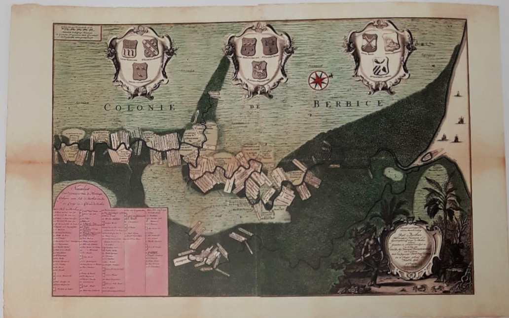
Plantagekaart van Berbice, met daarop de plantage Zeelandia ongeveer in het midden van de kaart.

varing, want eerder werd onder zijn leiding Tobago bezet. Een verlaten Frans fortje op Sint Eustatius werd door Van Corselles ingepikt, vervolgens uitgebreid en voorzien van de naam Fort Oranje. Het eiland als geheel kreeg de naam Nieuw Zeeland. Met Van Corselles reisde een groep kolonisten mee die het onzekere avontuur durfde aan te gaan in de verre Cariben. De meeste van hen waren Walen en Vlamingen. Van Corselles werd later aangesteld als commandeur van het eiland.