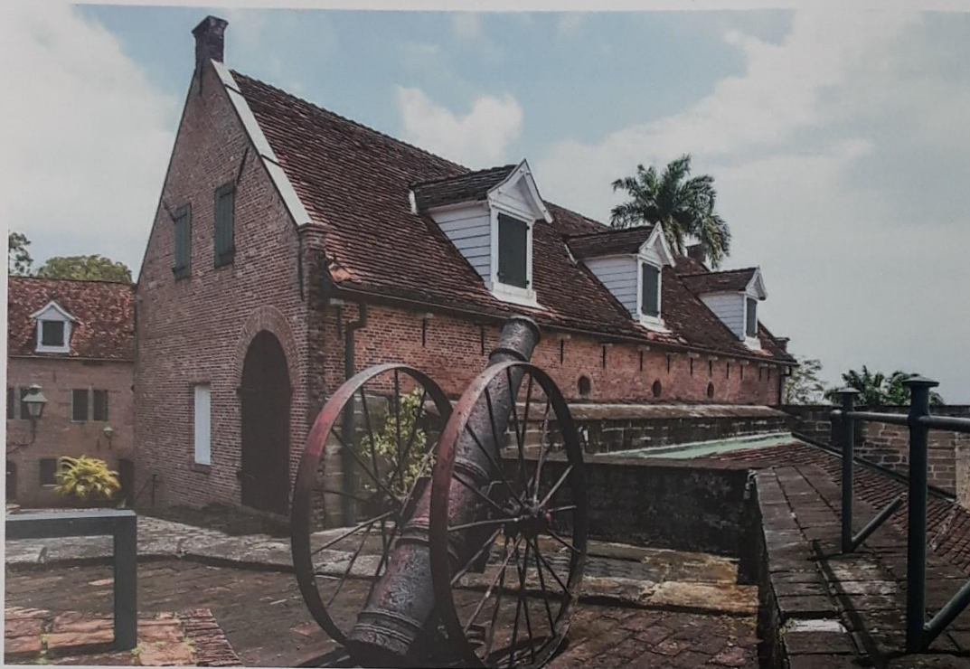
Deel van Fort Zeelandia, Paramaribo, Suriname. (bron: Internet)

Soldaaten en tot een Kruid Magazyn: aan den Waterkant lag nog een Horenwerk met Palissaden omzet, en met twaalf Stukken Kanon beplant; doch het zelve is thans vervallen. (...) Op het groot Vlaggen Eiland is het Gouvernement, de Secretary, en verdere Huizen van des Compagnies Bedienden en eenige byzondere Persoonen."