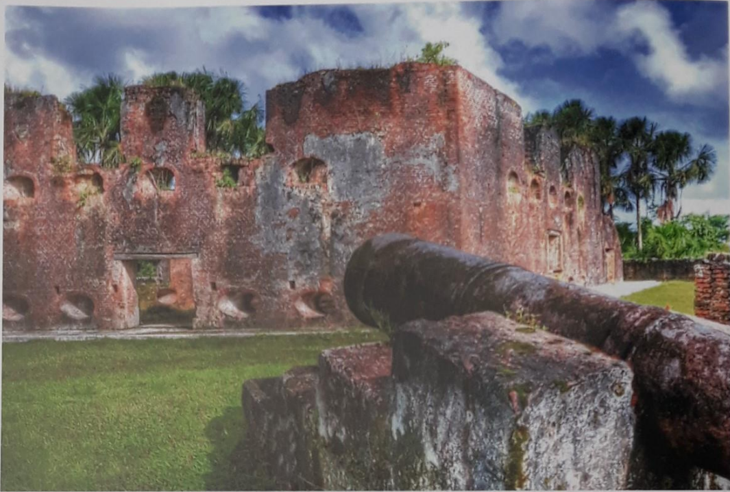
Deel van Fort Zeelandia, Vlaggeneiland, Essequibo.

kolonisten vertrokken. Vervolgens plunderde een Franse expeditie de kolonie aan het einde van het genoemde jaar. Na de verovering van Suriname door Abraham Crijnsens in 1667 kwam de Pomeroon weer onder Nederlands bestuur te staan. Ondanks dat werden in 1670 de laatste koloniebewoners geëvacueerd. Tot 1689 werd er in het restant van de kolonie nog wel handel gedreven met de bij de rivier woonachtige Indianen, maar met de verwoesting ervan door Franse kapers kwam er in dat jaar een definitief einde aan de tweede periode aan de Pomeroon. Tot slot volgde een derde, zeer korte periode aan het einde van de achttiende eeuw. Er werd weer nieuw leven geblazen in de voormalige kolonie met het opzetten van nieuwe plantages, maar deze episode zou snel voorbij zijn. Al in 1796 veroverden de Engelsen dit gebied. De Nederlanders zouden hier niet meer terugkeren.