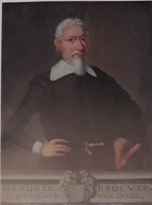
Ontdekkingsreiziger en VOC-bestuurder Hendrik Brouwer (1581-1643).

niet Staten(ei)land in Zuid-Amerika was en dat het zogenoemde Zuidland niet vast zat aan Zuid-Amerika, werd de door Tasman gegeven naam door Nederlandse cartografen veranderd in Nova Zeelandia of Nieuw Zeeland, uiteraard naar het Nederlandse gewest Zeeland. Nieuw Zeeland had ook een oorspronkelijke Maori-naam, namelijk Aotearoa dat zoveel betekent als 'land van de lange witte wolk'.