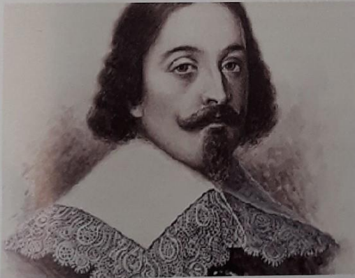
Portret van Abel Tasman.

Van alle gevonden Zeelandnamen is de soevereine staat Nieuw-Zeeland de bekendste. Dit land ligt ten oosten van Australië, maar behoort niet tot dat gelijknamige werelddeel. Nieuw-Zeeland wordt, samen met de ontelbare eilanden van zeer divers formaat in het zuidelijke deel van de Grote Oceaan, gerekend tot het gebiedsdeel Oceanië. Abel Tasman (1603-1659) wordt gezien als de Europese ontdekker van Nieuw-Zeeland. Hij werd geboren in Lutjegast en woonde in Hoorn, de Ommelanden en Amsterdam. Nadat hij een dienstverband aanging met de Verenigde Oostindische Compagnie (VOC) vestigde hij zich in Batavia, in Nederlands-Indië.