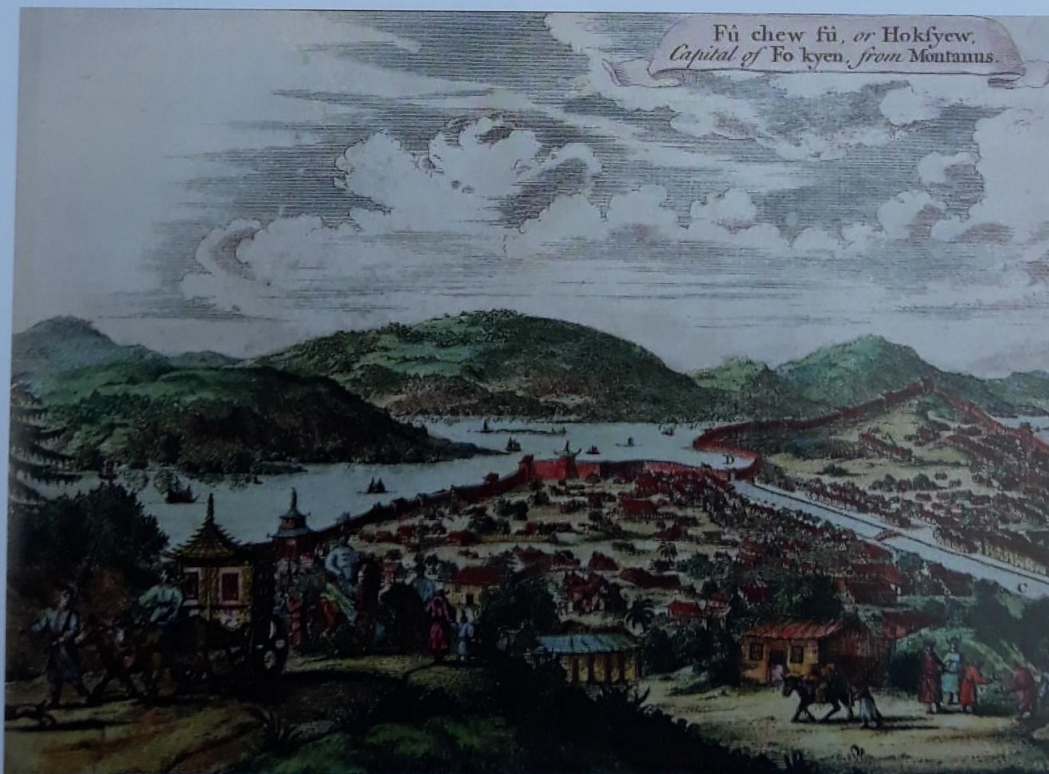
Uit: Grote Atlas van de VOC deel VII. Prent van de stad Hocsiew