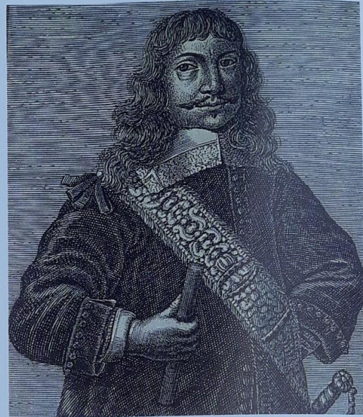
Portret van Balthasar Bort.

Tussen 1662 en 1664 werd diverse malen een vloot onder leiding van admiraal Balthasar Bort naar Hocsiew gezonden voor een aanval op die stad. In 1662 was er geen strijd op handen tussen Chinezen en Nederlanders, maar er was daar een lokaal Chinees conflict gaande. De VOC zag zijn kans schoon om hulp te bieden. Maritieme steun moest immers gaan leiden tot handelsprivileges, zo werd van het generale gouvernement verwacht. Borts gewelddadige optreden leidde tot een gunstig onthaal door de 'bevrijde' be-