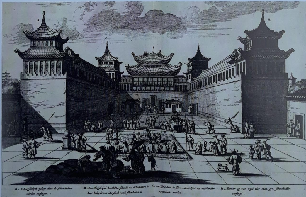
Prent uit Gedenkwaardig Bedryf van Olfert Dapper. Pieter van Hoorn bezoekt de keizer van China in 1666/1667