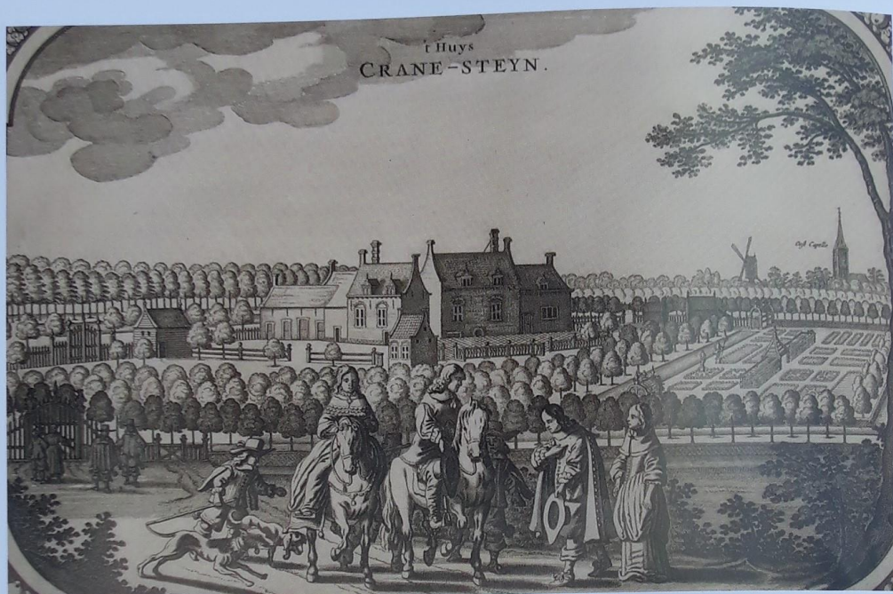
Prent van Cranestein uit 1662, in: Nicolaus Visscher, Speculum Zelandiae , Amsterdam 1668.

scher-Roman (1655) als Crane Hofste . In 1668 publiceerde Nicolaas Visscher een boek met een serie prenten. Onder de afbeeldingen bevond zich het landgoed van Crane, dat Cranestein werd genoemd. De tekening zou al in 1662