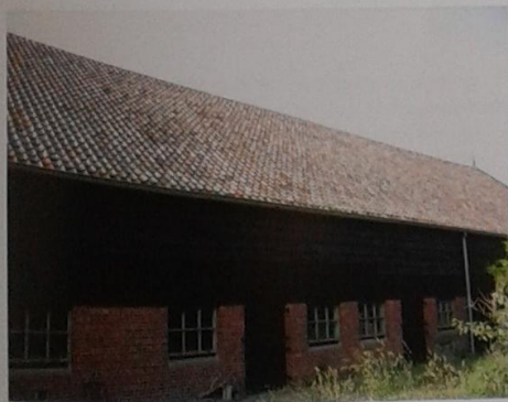
Boerenschuur van Ter Linde, voorzijde en achterzijde.