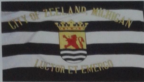
Vlag Zeeland, Michigan

de plaatsen Borculo, Drenthe, Graafschap, Groningen, Harlem, Holland, Noordeloos, Overisel, Vriesland en Zutphen.