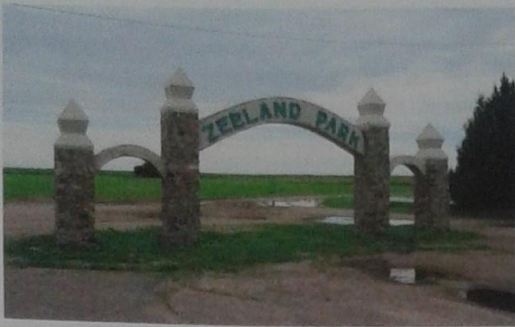
Zeeland Park, Zeeland, North Dakota

het binnenland met de Grote Oceaan. De Duits-Russische kolonisten noemden hun nieuwe nederzetting naar het zuidwestelijke deel van Nederland, vermoedelijk omdat hun nieuwe omgeving in het verleden met grote regelmaat onder water had gestaan en er nog steeds veel werk verzet moest worden om dit gebied droog te houden. Kennelijk wisten de kolonisten niet alleen af van de Zeeuwse strijd tegen het zeewater, maar ook tegen die van het binnenwater en was de naamgeving een uiting van een zekere verbondenheid.