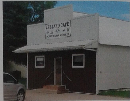
Zeeland Café, Zeeland, North Dakota

In 1940 waren er, op het hoogtepunt van de bloei, bijna 500 inwoners in Zeeland. Zes jaar later kreeg het plaatsje de status van city . De afname van het bevolkingsaantal verliep vooral na 1960 gestaag. Het ooit zo welvarende