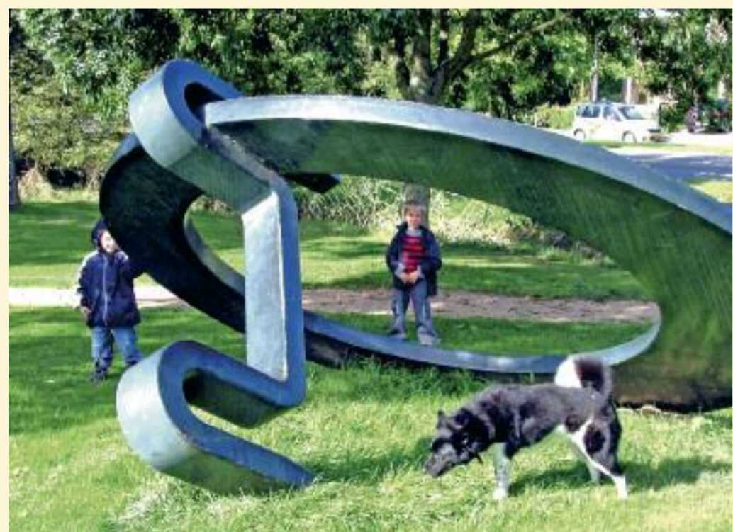
Zon schrijft schaduw (Westduinpark)