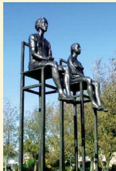
Het Paar 2003