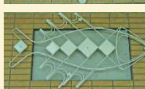
Vijf smeedijzeren kunstwerken in de torenflats.