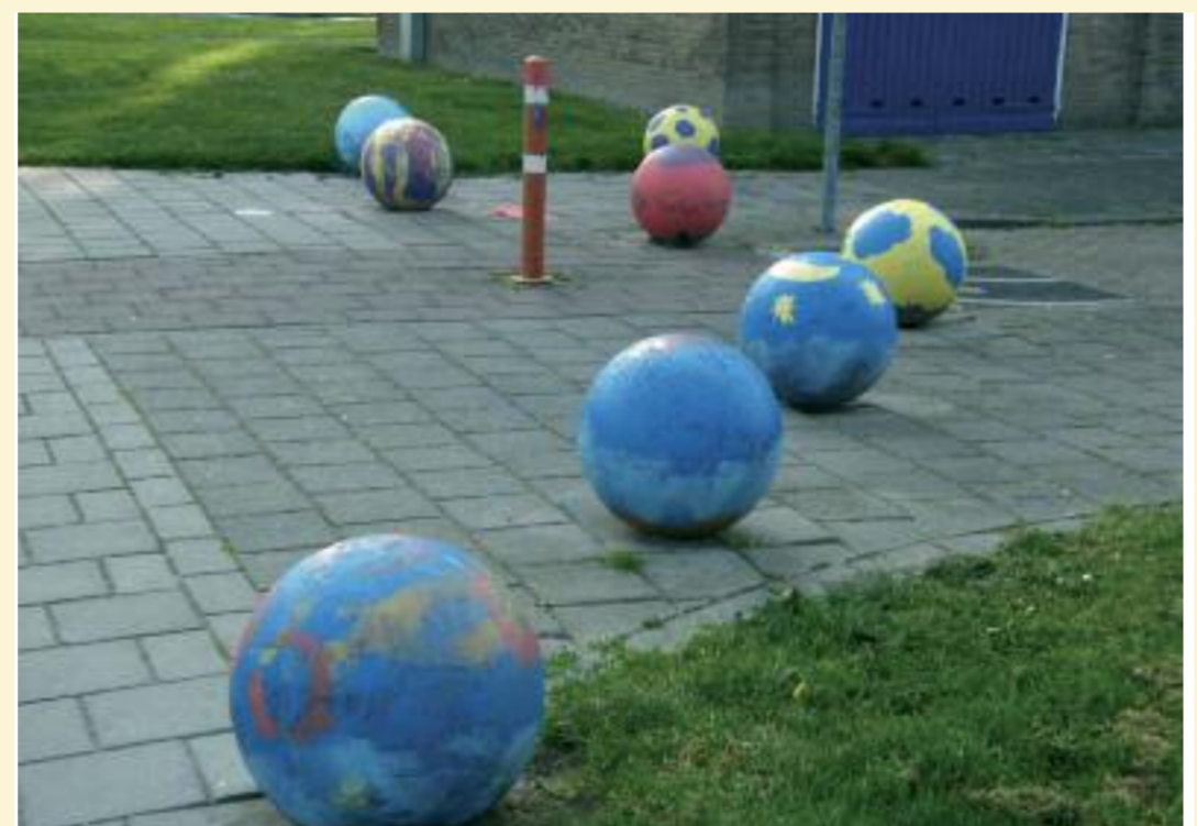
(Verkeers)bollen aan een van de pleintjes aan de Sloeweg.