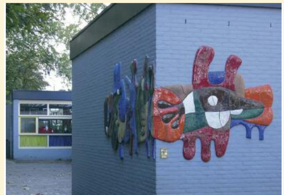
Keramisch reliëf, Louise de Colignyschool.