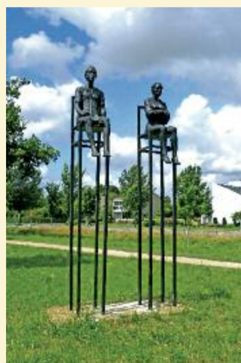
Het Paar 2009.