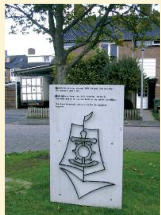
Plaquette op plein van voormalig internaat Onze Vloot.