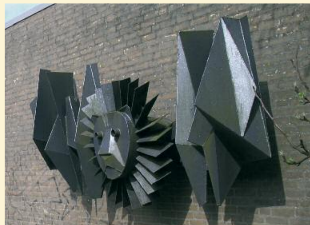
Gevleugelde leeuw, Markusschool.