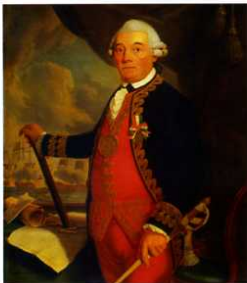
Johan Arnold Zoutman door Cornelis van Cuylenburg (II) (collectie Rijksmuseum)