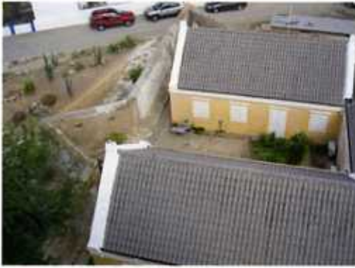
Fort Zoutman op Aruba. Bij de in de jaren zeventig van de vorige eeuw uitgevoerde restauratie is de noordmuur met de 'halfbastions' weer hersteld

te bouwen vesting was gepland, diende in verband met hoogteverschil te worden aangepast. Dat deed men door eerst een stenen muur te bouwen en vervolgens het zuidelijk gelegen deel op te vullen met keien en aarde. Hierdoor werd deze zijde van het fort zelfs nog zo'n halve meter hoger dan het noordelijke deel en fungeerde zo als een soort verdedigingswal. Het voor de muur liggende binnenplein vormde de appèlplaats. De huidige betonnen muur dateert niet meer van de begintijd, maar werd in 1936 opgetrokken.