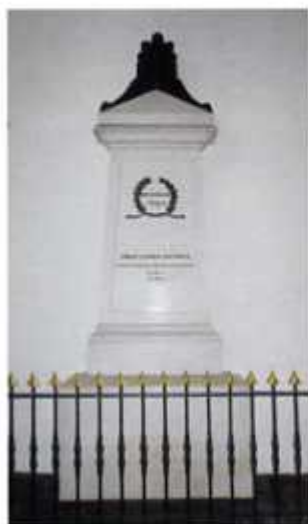
Gedenkmonument in de Geer- truidsherk te Geertruidenberg

plannen werden meestal niet uitgevoerd. Kort voor zijn dood in 1793 werd Zoutman nog bevorderd tot luitenant-admiraal en commandant der zeertilleristen.