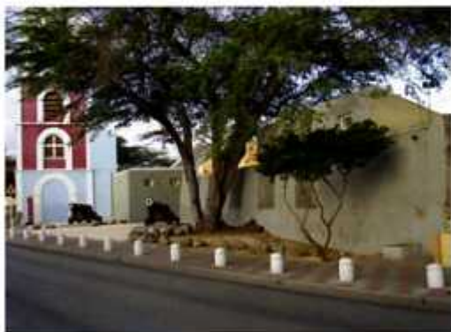
Voor de hoofdingang van Fort Zoutman staat de voormalige vuurtoren Willem III

In 1868 is vóór de hoofdingang van het fort een vuurtoren gebouwd die werd genoemd naar de toenmalige koning van Nederland, Willem III. Na het verlies van zijn functie als bakken werd het gebouw Stadstoren. Hoewel het één geheel lijkt – en nu feitelijk is – zijn de twee bouwwerken afzonderlijk ontstaan.