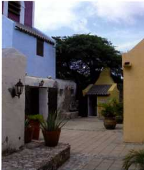
Fort Zoutman op Aruba. Van de oorspronkelijk bebouwing is alleen het bakhuisje (op de achtergrond) nog in oorspronkelijke staat

Omdat al in de periode 1830-1834 de militaire functie was losgelaten, werd Fort Zoutman voor allerlei mogelijke en onmogelijke doeleinden gebruikt. Zo heeft het dienst gedaan als gevangenis, politiepost, rechtbank, belasting- en postkantoor, radiostation maar ook als proeftuin voor aloëplantjes. Er werden huwelijken gesloten en het werd gebruikt als opslagplaats van de dienst openbare werken. Zelfs vuurwerk mocht hier worden opgeslagen en als klap op de vuurpijl werden in het fort doodskisten bijgezet van mensen zonder geld voor een graf! Multifunctionaliteit kan in dit geval niet worden ontkend.